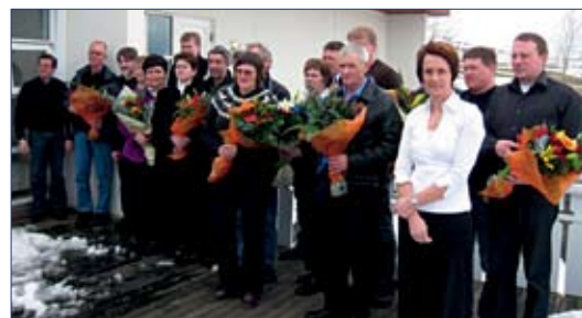
Verðlaunahafar í Norðausturdeild.