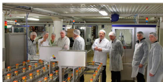
Fulltrúar á aðalfundi skoða þökkunarlinur á Selfossi