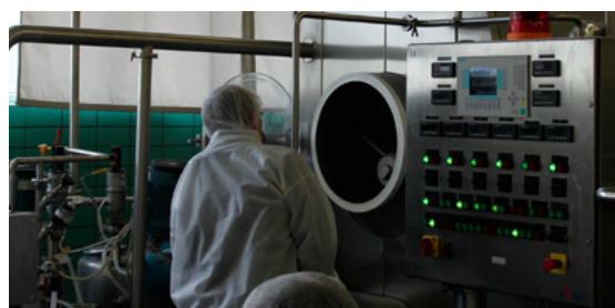
Tæknin vekur athygli eins fulltrúa