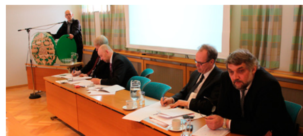
Fundarstjórar, forstjóri og stjórnarmaður Auðhumlu á aðalfundinum