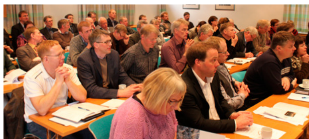
Fulltrúar á aðalfundi Auðhumlu