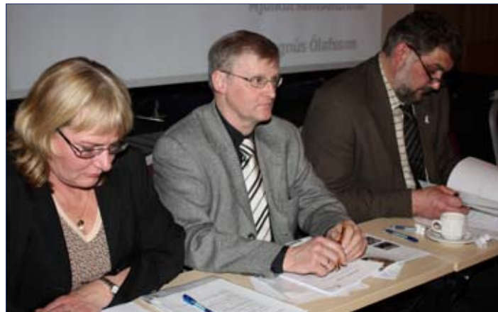
Fundarstjórar og formaður.