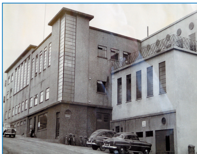
Mjólkursamslag KEA í Grófgargili 1939-1980.