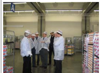
Stjórn MS og forstjóri ræða málin í mjólkurkæli MS í Reykjavík

Stjórn MS ákveður flutningsgjaldið fyrir eitt ár í senm. Stjórnin hefur ákveðið að flutningsgjaldið á árinu 2006 verði kr. 2,05 pr. ltr.