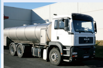
Flutningsgjald á mjólk lækkar